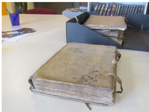
Registres des audiences de la police conservés dans les archives municipales de la Ville de La Rochelle. / Records of police hearings kept in the municipal archives of the City of La Rochelle.

Looking at the police registers, available in the municipal archives of the City of La Rochelle, we find that, at almost every police hearing, a good number of residents are fined for violating the bylaw on the removal of rubbish and stuffers (garbage) in front of their house and cobblestones. What about these regulations?