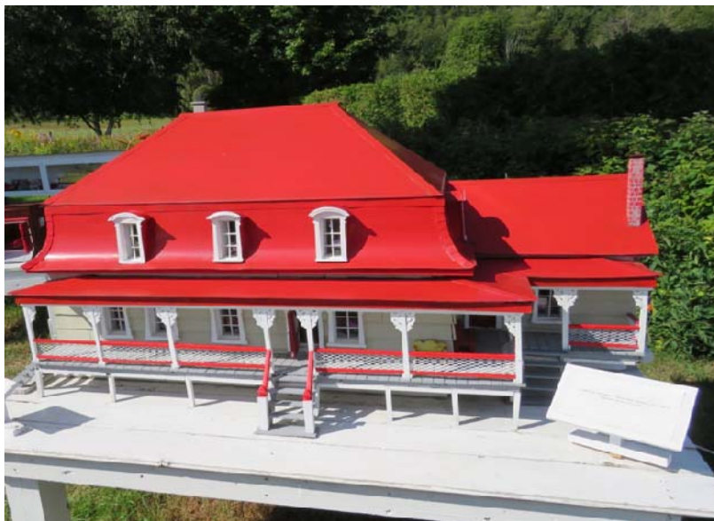
La réplique de la maison ancestrale : le toit se soulève et à l'intérieur on voit les petites lumières qui ont été installées. / The replica of the ancestral home : the roof lifts and inside one can see the little lights that have been installed