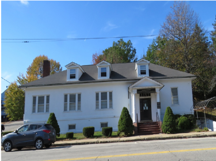
La Société historique de Summersworth et son musée situé au 157, rue Main. / The Summersworth Historical Society and Museum situated at 157 Main Street.

Beaucoup d'immigrants canadiens-français demeuraient dans la région à l'autre bout de la rue Main (à l'autre extrémité de la gare de train) appelée Smokey Hollow. On la nommait ainsi à cause de la fumée persistante des poêles à bois dans cet endroit peu élevé.