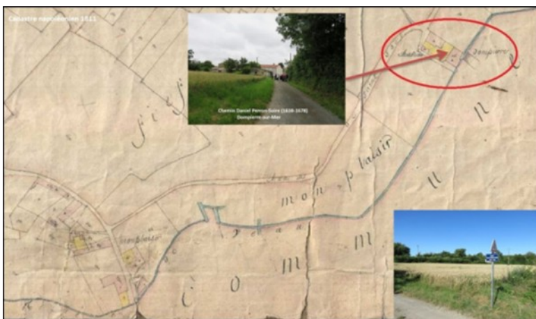
Localisation du château de Dompierre (fief Monplaisir). / Location of the castle of Dompierre (stronghold Monplaisir).

La plaque est située à l'emplacement du Château de Dompierre (démoli), dans une salle duquel a été baptisé Daniel Suire, le 26 décembre 1638.